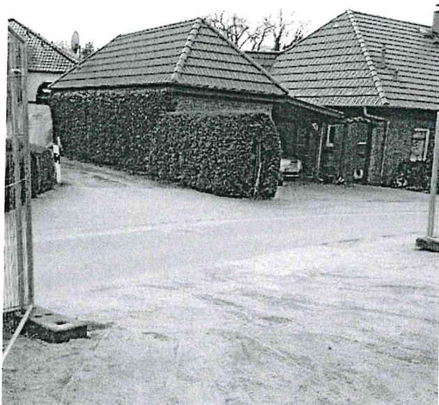
Sonnenweg und geplante Grundstückszufahrt.