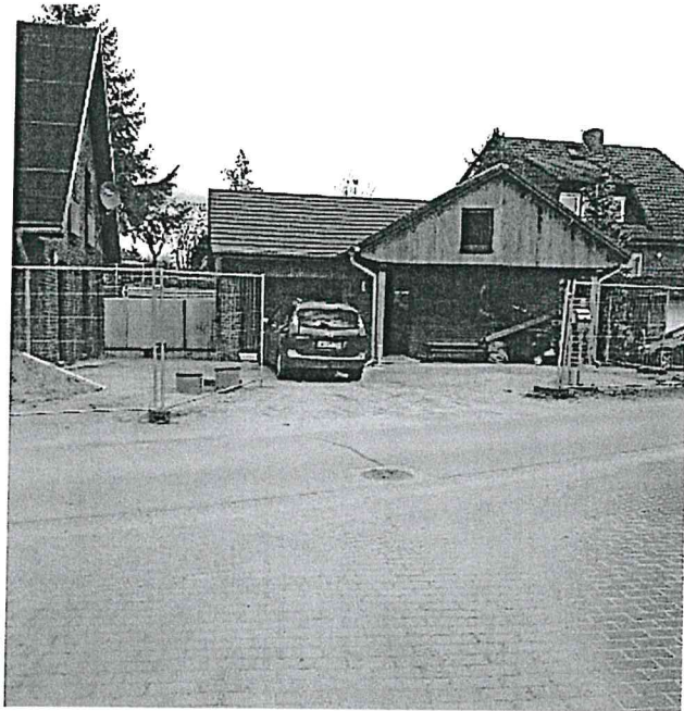
Blick vom Sonnenweg aus auf die geplante Grundstückszufahrt.